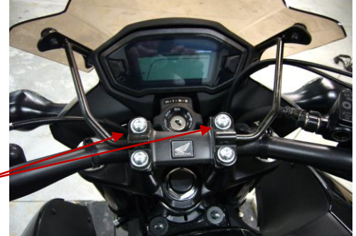
Photo 2 Screws to remove and replace